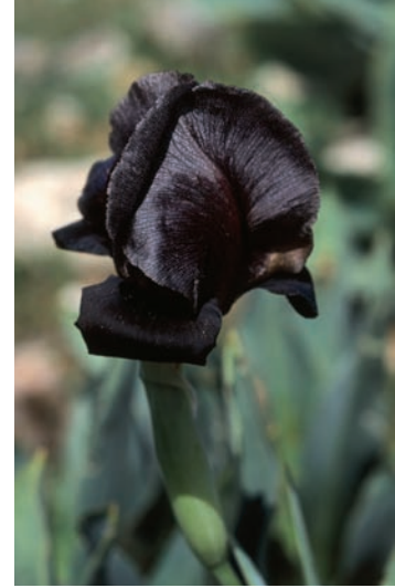
THE BLACK IRIS Jordan's National Flower